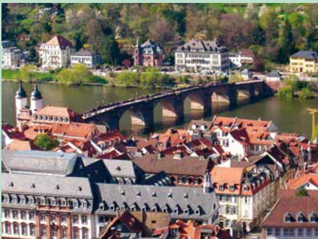
Heidelberg (Altstadt & Schloss)